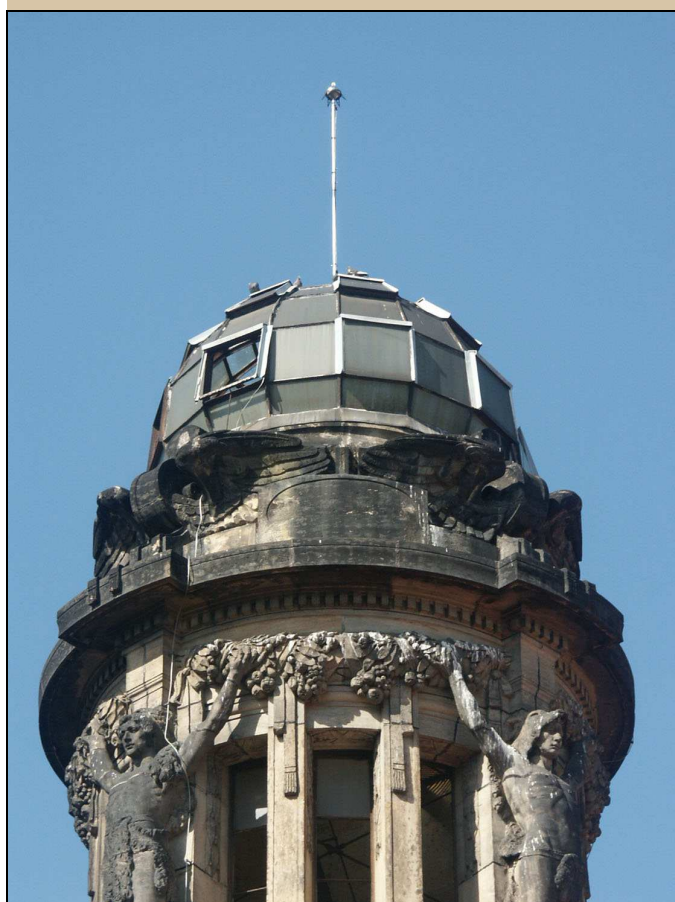
pohled na kupoli z exteriéru